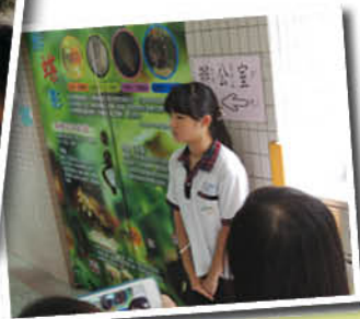
▲學校的各部門也是學習蝴蝶的好地方