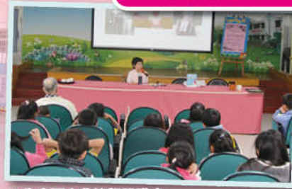
▲生命鬥士典範學習講座