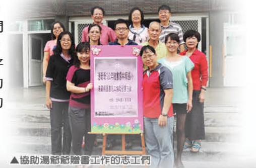
▲協助湯爺爺贈書工作的志工們

閱讀能為孩子的視界打開一扇窗，也能點亮孩子的未來，因此希望孩子們能多接近圖書室、新書展、行動書車，遨遊於書海中。感謝各界的贊助，讓好書源源不絕；感謝協助學校閱讀推動的團體、老師、志工媽媽，您們讓孩子的生活因為閱讀而更美好。