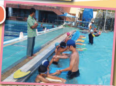
▲101學年度暑假游泳夏令營，本校游泳教學初體驗。