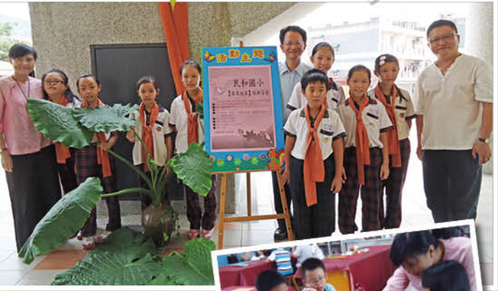
▲平日的練習是每次茶席展演成功的關鍵