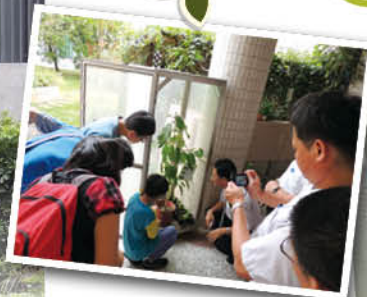
▲猜猜這是哪一種蝴蝶的蛹