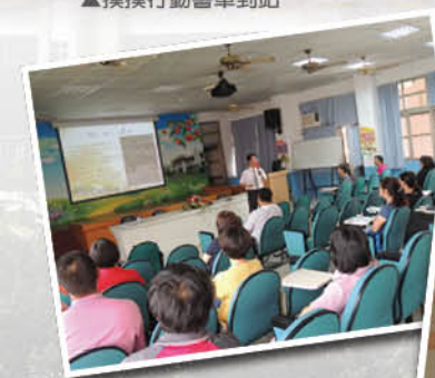
▲校長帶頭做閱讀分享