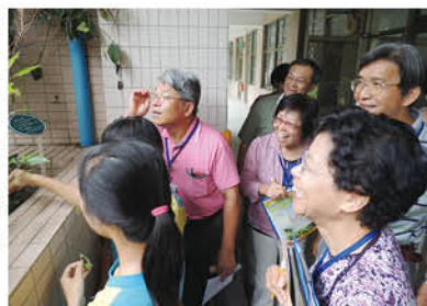
▲小小解說員導覽蝴蝶生態

端詳這獎座，以代表大自然的花朵、樹藤之抽象造型為出發點，結合人類之雙手正緊緊包覆地球，傳達著人類對於我們所居住的大地，捧在手心之愛惜呵護的心意。我們願意付諸於行動，用雙手實踐，以生態作為校本課程，期待孩子們從學習的過程中，培養尊重生命、認真做事和負責的態度，體驗生命的可貴與愛護大自然，共創綠意盎然之環境的永續發展！