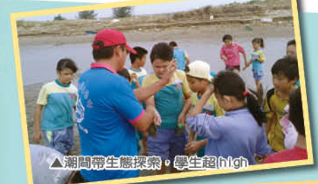
▲潮間帶生態探索，學生超high