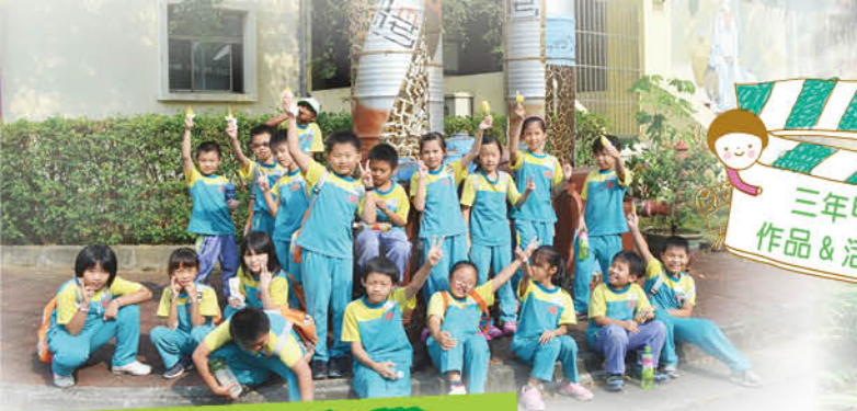
三年甲班 作品 & 活動照