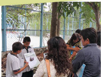
▲利用圖片來為你解說甲蟲