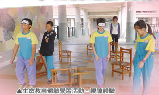
▲生命教育體驗學習活動 - 視障體驗