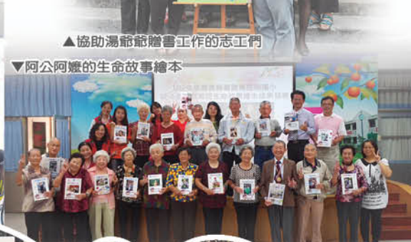
▼阿公阿嬤的生命故事繪本