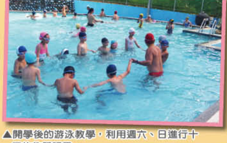
▲開學後的游泳教學，利用週六、日進行十天的教學課程。