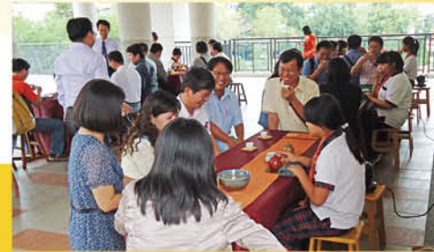
▲用細心與誠心泡出的茶總是特別的甘甜