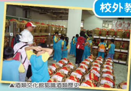
▲酒類文化館認識酒類歷史