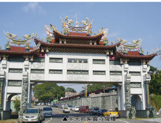
▲半天岩紫雲寺牌樓

番路鄉位於嘉義市東方，有山有水，可說是嘉義市的後花園。筆者來番路鄉服務十年了，說我是半個番路人也不為過吧！我這半個番路人常常是以番路鄉的各景點為家人散心的好去處：