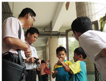
▲要不要看看竹節蟲的翅膀在那兒