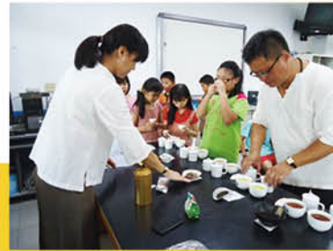
▲茶藝師指導辨識不同茶湯的顏色氣味