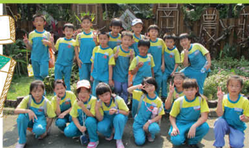
三年乙班 作品 & 活動照

我喜歡釣魚，因為釣魚讓我有成就感。我釣魚的時候會先把魚餌鉤在魚竿的鉤子上，然後把魚鉤放到水裡去。我耐心的等待魚兒上鉤，突然，浮標有動靜了，魚開始吃魚餌了，有一隻魚上鉤了。我用力一拉，終於釣到魚了。