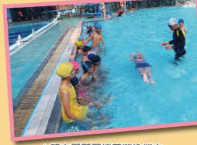
▲努力學習習培養游泳能力。