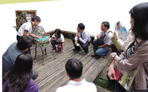
▲蓋斑鬥魚你猜如何分公母呀