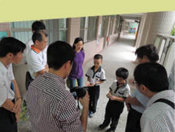
▲快來看我的竹節蟲

民國小校園生態豐富，對大多數人來說既有點熟悉卻又陌生；但這是需要與大眾分享的，基於此理念就培訓了小小解說員，希望經由小小解說員的熱情解說將校園豐富生態呈現給每個參觀者。