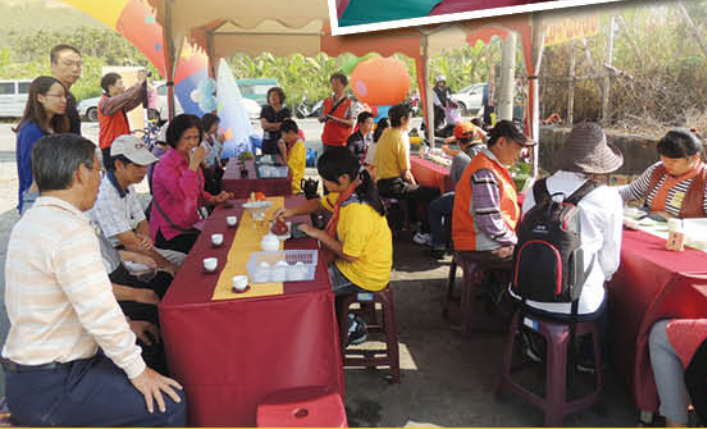
▲於地方盛事 - 柿子節活動會場設茶席奉茶