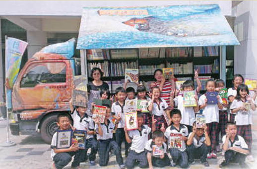
▲撲撲行動書車到站