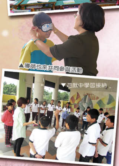
▲視障體驗 - 你是我的眼