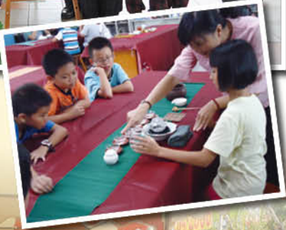
▶細心的指導泡茶時的每個細節